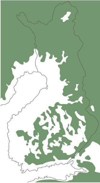
Suomen rantaviiva jääkauden jälkeen

tenkin tuiki harvinaista. Tavallisesti syntipukkia etsitään maataloudesta ja peltoviljelyyn käytettävistä lannoitteista, jotka vesistöihin joutuessaan aiheuttavat rehevöitymistä. Usein unohdetaan, että ilmiöön on myös täysin luonnollinen syy, johon ihminen ei voi mitenkään vaikuttaa, nimittäin maankohoaminen.