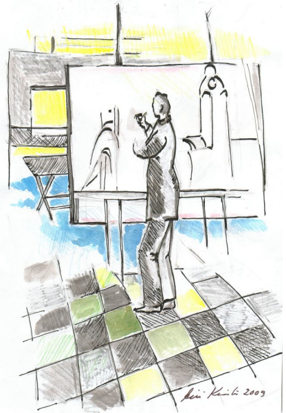
Suomen kenties tunnetuin arkkitehti Eliel Saarinen syntyi Rantasalmen pappilassa 1873